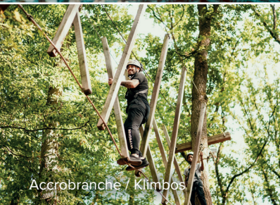
Accrobranche / Klimbos