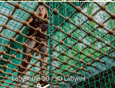
Labyrinthe 3D / 3D Labyrint